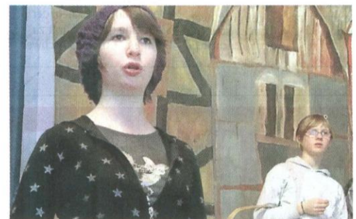
Viele Wochen haben die Achtklässler für die Premiere ihres Klassenspiels am Freitag geprobt.