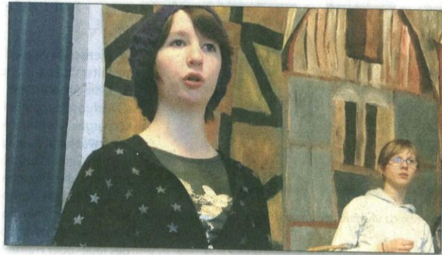
Den Jugendbuchklassiker „Prinz und Bettelknabe“ bringen die Achtklässler der Rudolf-Steiner-Schule am Wochenende auf die Bühne.

Aufführungstermine sind am Freitag, 19. Februar, um 20 Uhr, am Samstag (20.) um 16 Uhr, am Sonntag (21.) um 16 Uhr. Das Stück wird im kleinen Festsaal der Rudolf Steiner Schule, Hauptstraße 238, aufgeführt. Der Eintritt ist frei.